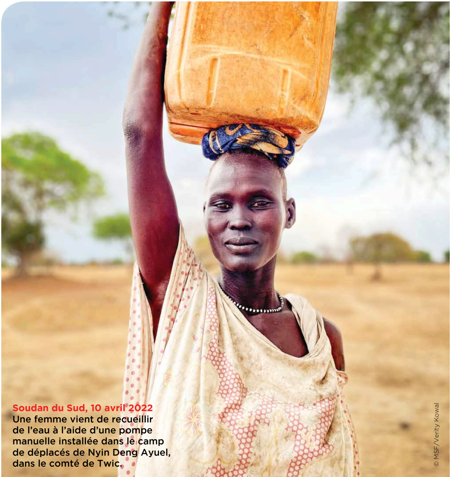
Soudan du Sud, 10 avril 2022 Une femme vient de recueillir de l'eau à l'aide d'une pompe manuelle installée dans le camp de déplacés de Nyin Deng Ayuel, dans le comté de Twic.